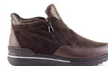
MINILA 35-42 | Marron CHUT