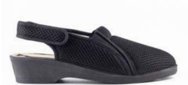
OPALA 35-41 | Noir CHUT