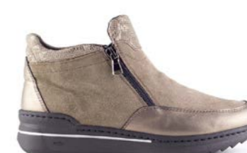
MINILA 35-42 | Taupe CHUT