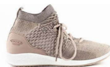
REINA 37-42 | Beige CHUT