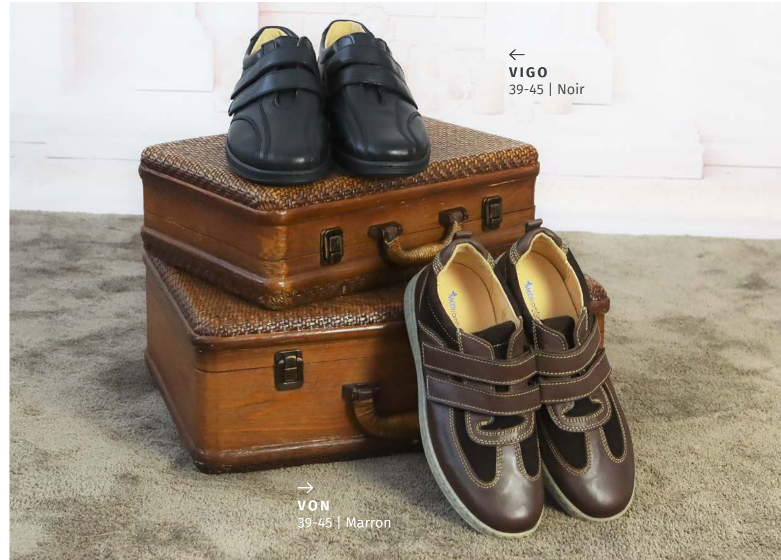
← VIGO 39-45 | Noir