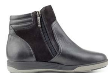
KOLOR 35-41 | Noir CHUT