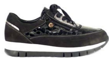
KLAUS 35-41 | Noir CHUT