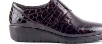
WUV 35-41 | Marron CHUT