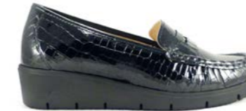
MACI 35-42 | Noir CHUT