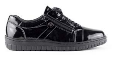
KANTIA 35-41 | Noir CHUT