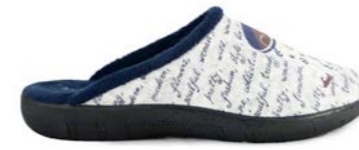
SUELI 35-41 | Bleu