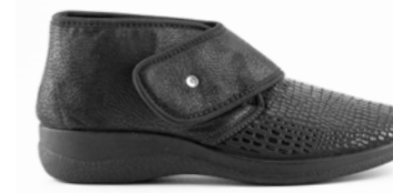
FERAN 35-42 | Noir CHUT