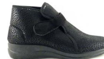
FLEUR 35-42 | Noir CHUT