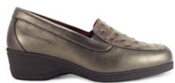
MARIBOR 35-42 | Gris CHUT