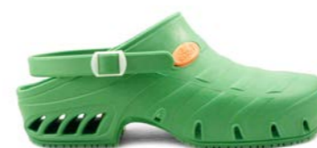
CLOG STUDIUM 35-45 | Vert