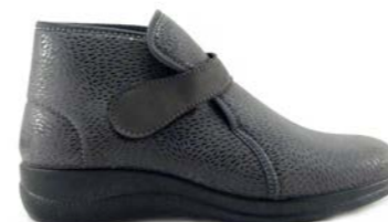
FLEUR 35-42 | Gris CHUT