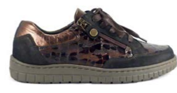
KURT 35-41 | Marron, Noir CHUT