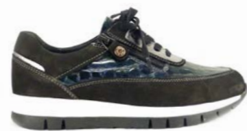
KLAUS 35-41 | Bleu CHUT