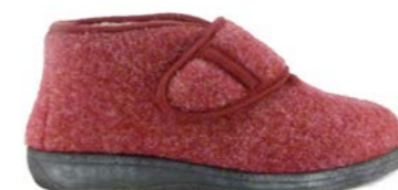
OLIVE 35-41 | Bordeaux CHUT