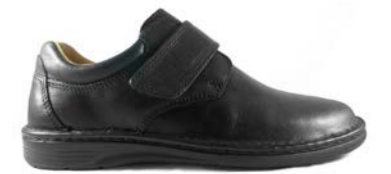
VICENTE 39-45 | Noir CHUT