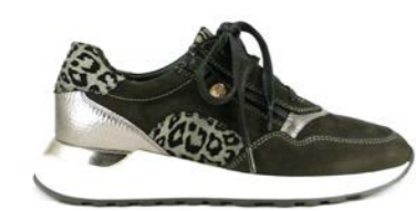
KURAMA 35-41 | Noir CHUT