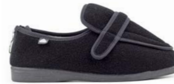
CRISTINA 36-44 | Noir CHUT