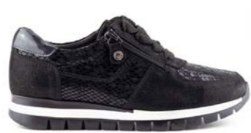
KASUMI 35-41 | Noir CHUT