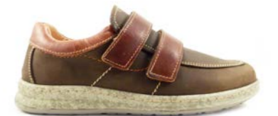
VICTOR 39-45 | Marron CHUT