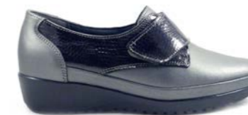
KEVIN 35-41 | Gris, Noir CHUT