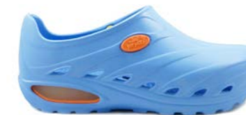
CLOG DINAMIC 35-45 | Bleu