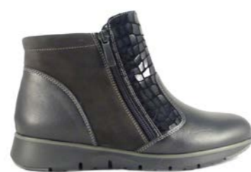
KOLA 35-41 | Noir CHUT