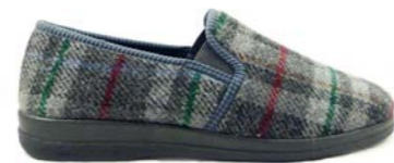
CORDOBA 39-45 | Gris CHUT