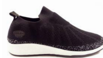
RUBIA 37-42 | Noir CHUT