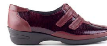
KLOVE 35-41 | Bordeaux CHUT