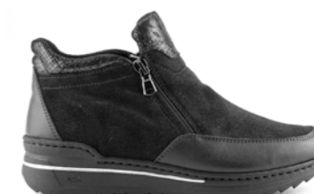
MINILA 35-42 | Noir CHUT