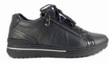
MULARI 35-41 | Noir CHUT