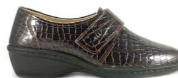
MAXIMUS 35-42 | Marron, Taupe CHUT