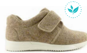
FLOYD 35-42 | Beige CHUT