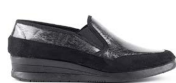
FARUK 35-42 | Noir CHUT