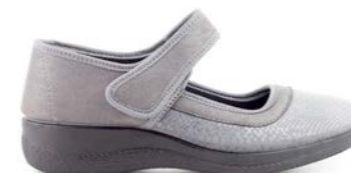
FLORI 35-42 | Gris CHUT