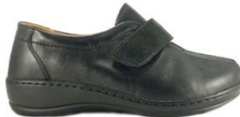
MELCA 35-42 | Noir CHUT