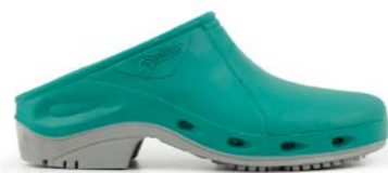
SOCA TROKLÓ 141 35-45 | Vert