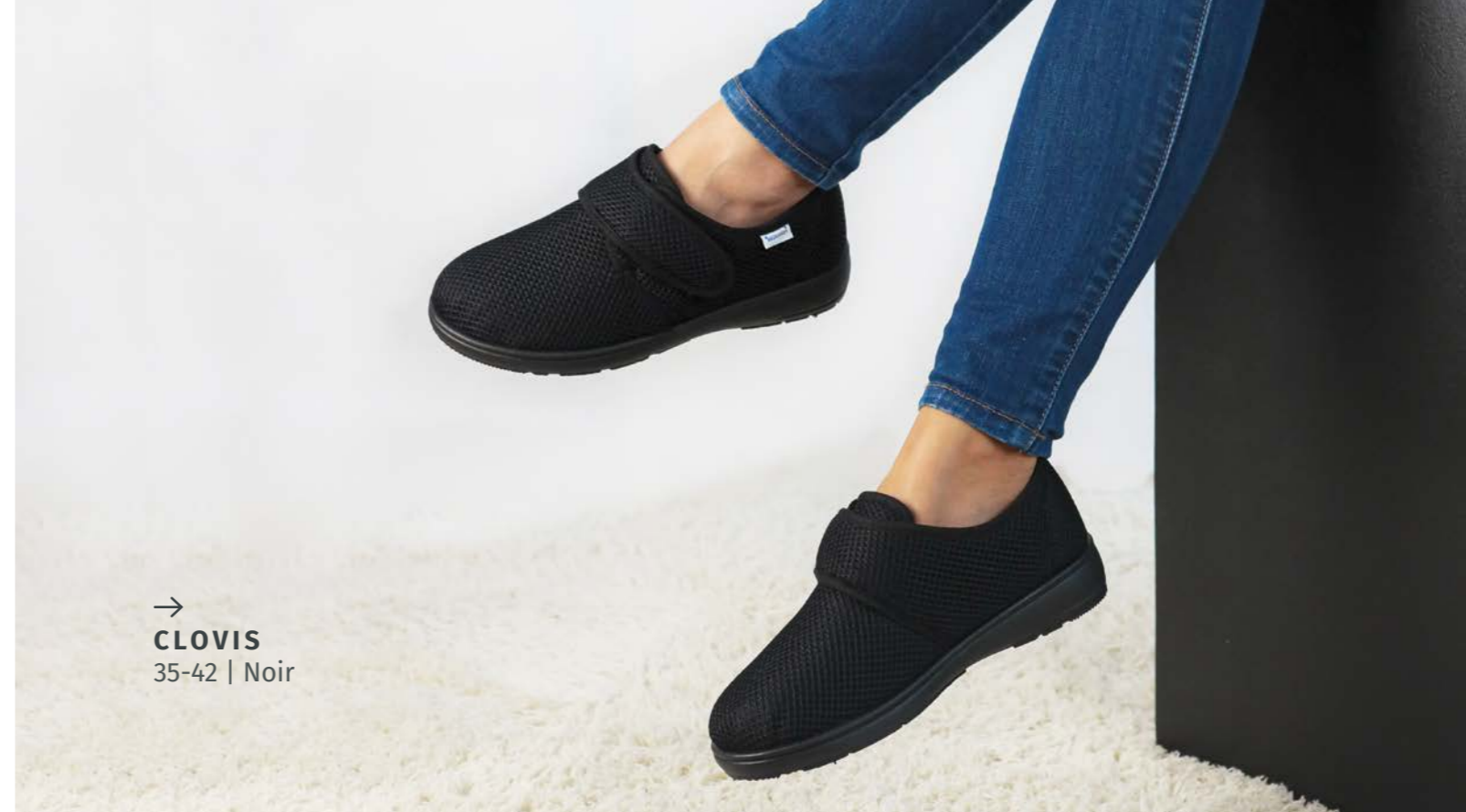
→ CLOVIS 35-42 | Noir