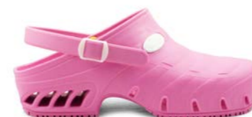
CLOG STUDIUM 35-45 | Rose