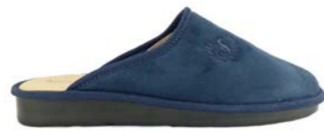
SALVADOR 39-45 | Bleu