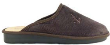
SANTANA 39-45 | Marron