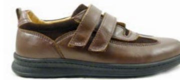
VON 39-45 | Marron CHUT