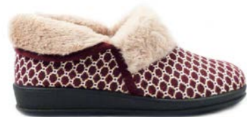
CAPRI 36-42 | Bordeaux CHUT