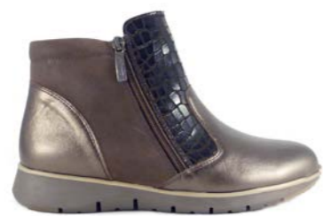
KOLA 35-41 | Marron CHUT