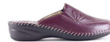
GEOVANA 35-41 | Bordeaux