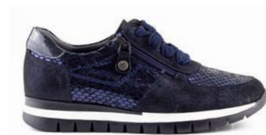
KASUMI 35-41 | Bleu CHUT