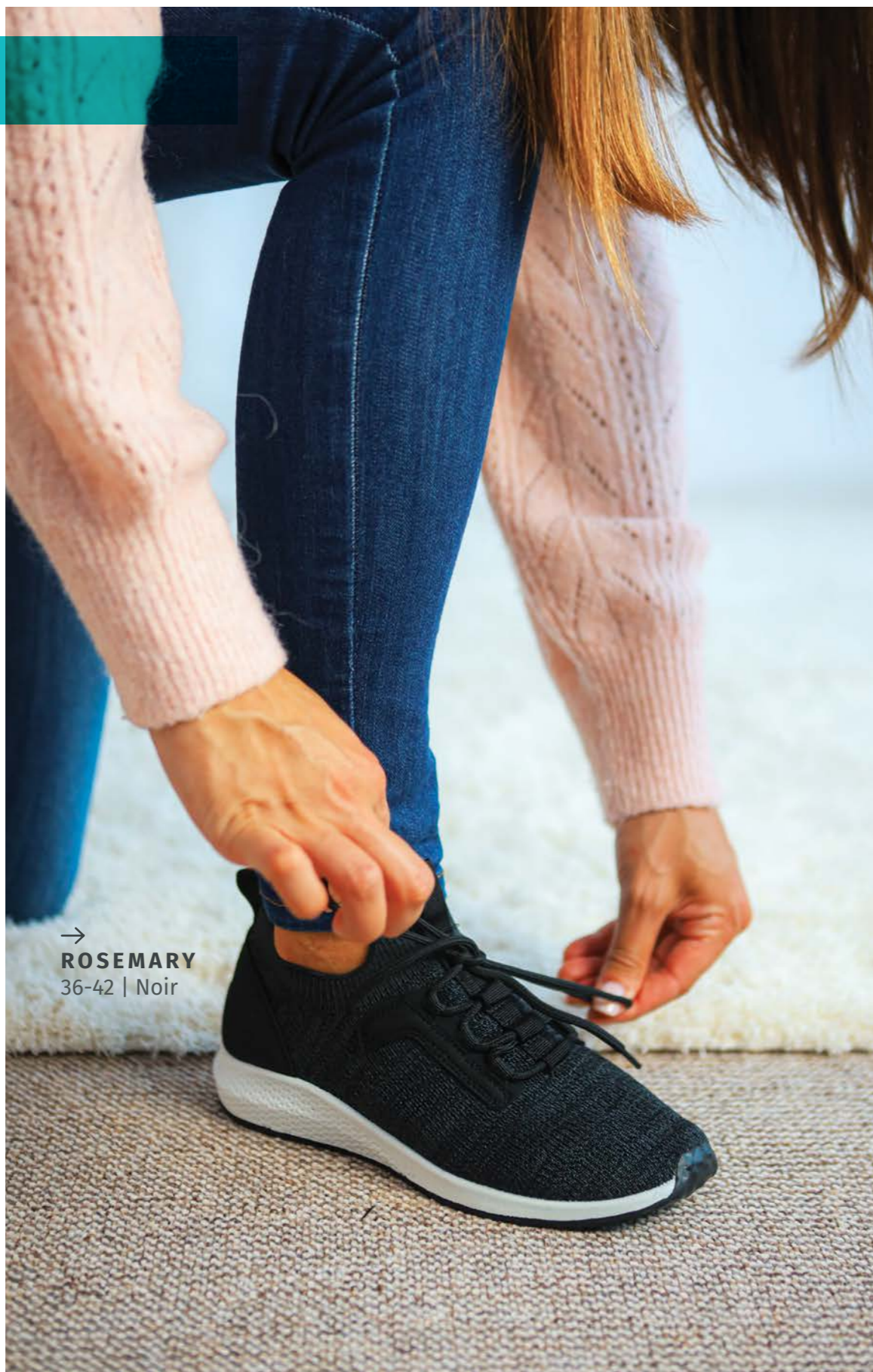
→ ROSEMARY 36-42 | Noir