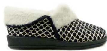
CAPRI 36-42 | Noir CHUT