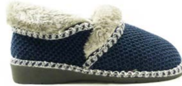
AMBER 35-41 | Bleu CHUT