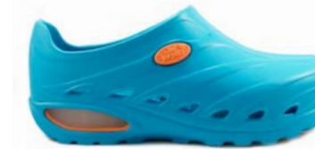
CLOG DINAMIC 35-45 | Vert