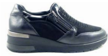
WILSON 35-41 | Noir CHUT