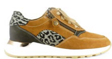
KURAMA 35-41 | Camel CHUT