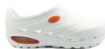
CLOG DINAMIC 35-45 | Blanc