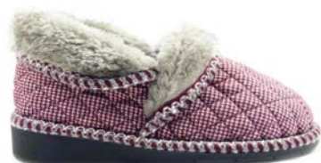
ANABELA 35-41 | Bordeaux CHUT