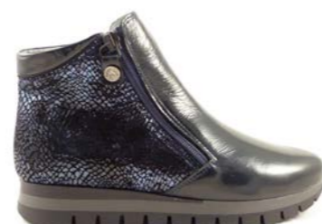
KRISTIA 35-41 | Bleu CHUT