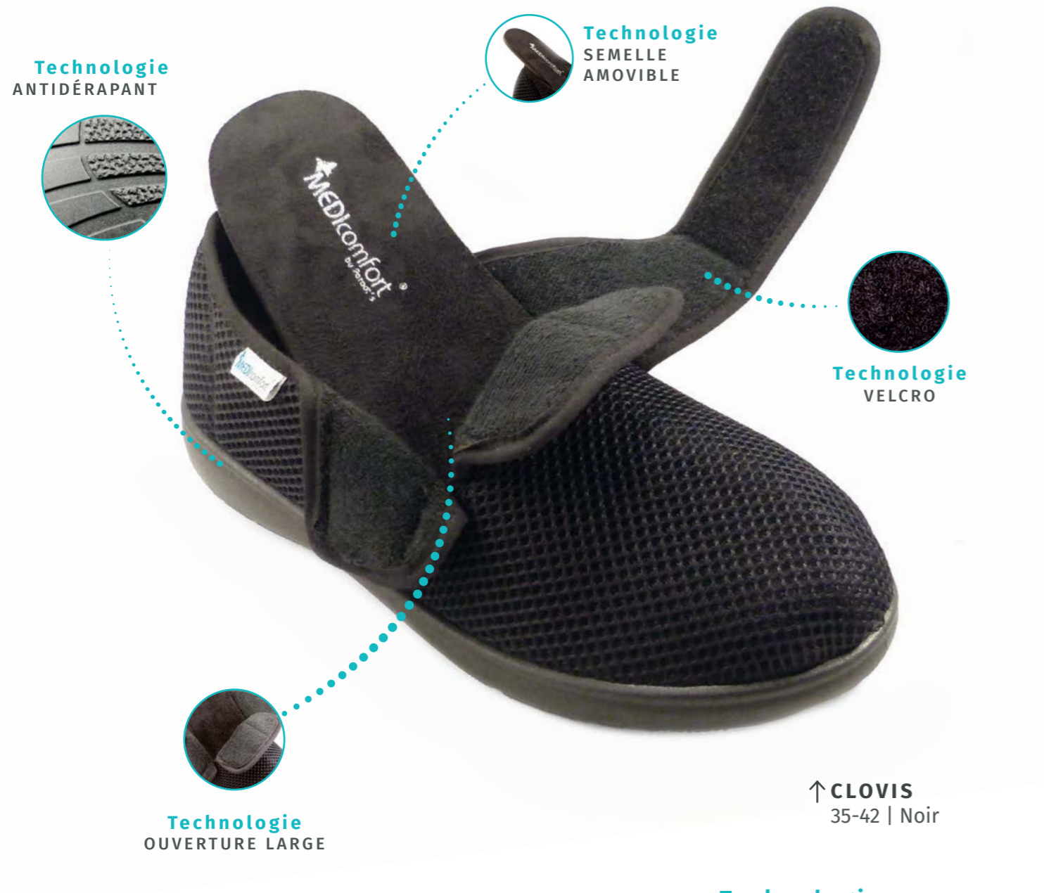
↑ CLOVIS 35-42 | Noir

Chaussures avec doublure en bambou et fil d'argent, hypoallergénique et aux propriétés antibactériennes. Système antidérapant sur la semelle qui offre une bonne adhérence lors de la marche.