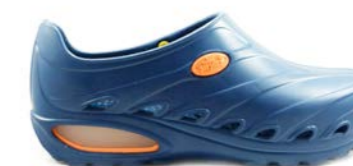
CLOG DINAMIC 35-45 | Marino