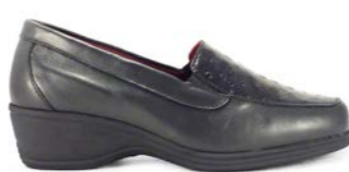
MARIBOR 35-42 | Noir CHUT