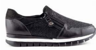
KASHA 35-41 | Noir CHUT