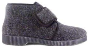
OLEEN 39-45 | Gris CHUT