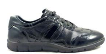
BARBOSA 35-41 | Noir CHUT