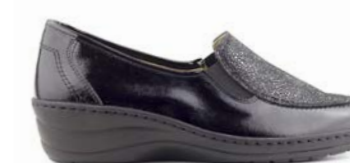
MARIVALDO 35-42 | Noir CHUT