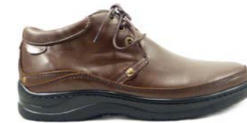
VITAL 39-45 | Marron CHUT