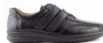
VIGO 39-45 | Noir CHUT