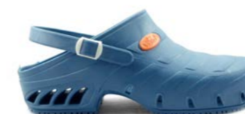
CLOG STUDIUM 35-45 | Bleu