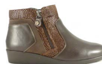
KONDE 35-41 | Marron CHUT