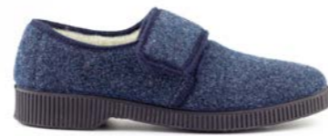
OCTOBER 39-45 | Bleu CHUT