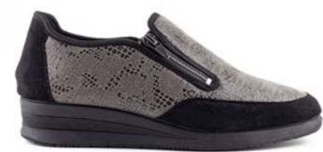
FANG 35-42 | Gris, Noir CHUT