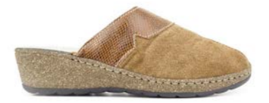
CAILET 35-41 | Marron