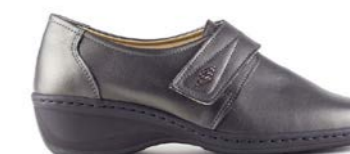
MATSU 35-42 | Gris CHUT