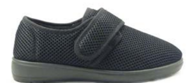
CLOVIS 35-42 | Noir CHUT