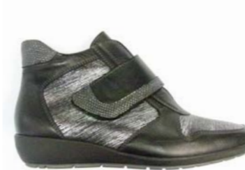
KURIS 35-41 | Noir, Marron CHUT