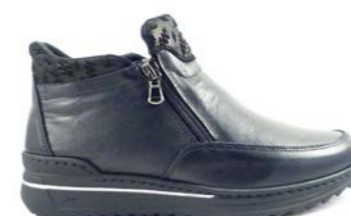
MINILA.PELE 35-42 | Noir CHUT