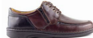
VANDER 39-45 | Marron CHUT