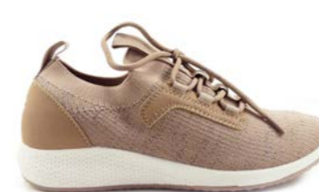
ROSEMARY 36-42 | Beige CHUT