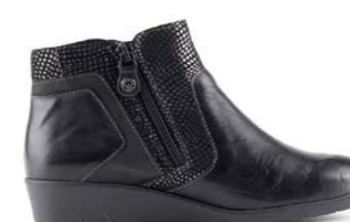
KONDE 35-41 | Noir CHUT