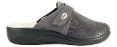
SYLVIE 35-41 | Gris