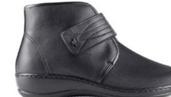
MALAQUIAS 35-42 | Noir CHUT