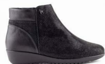
KIA 35-41 | Noir CHUT