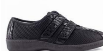
OSNIA 35-41 | Noir CHUT