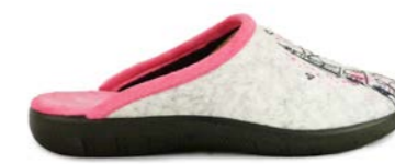
SOLE 35-41 | Rose