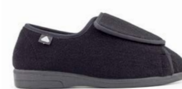
CONSUELA 36-44 | Noir CHUT