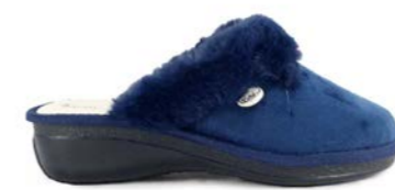
SERENA 35-41 | Bleu