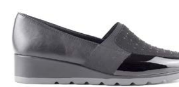
WILFRED 35-41 | Noir CHUT