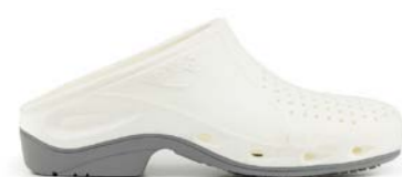
SOCA TROKLÓ 140 35-45 | Blanc