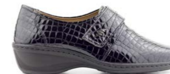
MAXIMUS 35-42 | Noir, Taupe CHUT