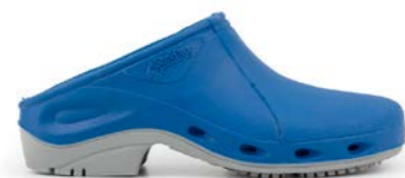
SOCA TROKLÓ 141 35-45 | Bleu