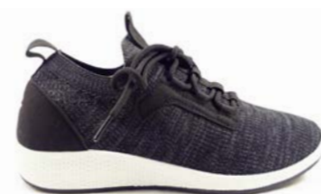
ROSEMARY 36-42 | Noir CHUT