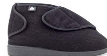
CLOE 36-44 | Noir CHUT