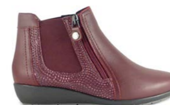
KENAI 35-41 | Bordeaux CHUT