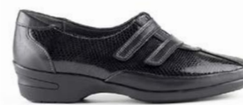
KLOVE 35-41 | Noir CHUT