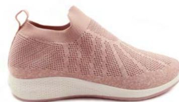
RUBIA 36-42 | Rose CHUT