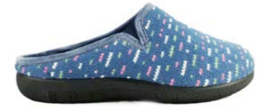
SIMONE 35-41 | Bleu