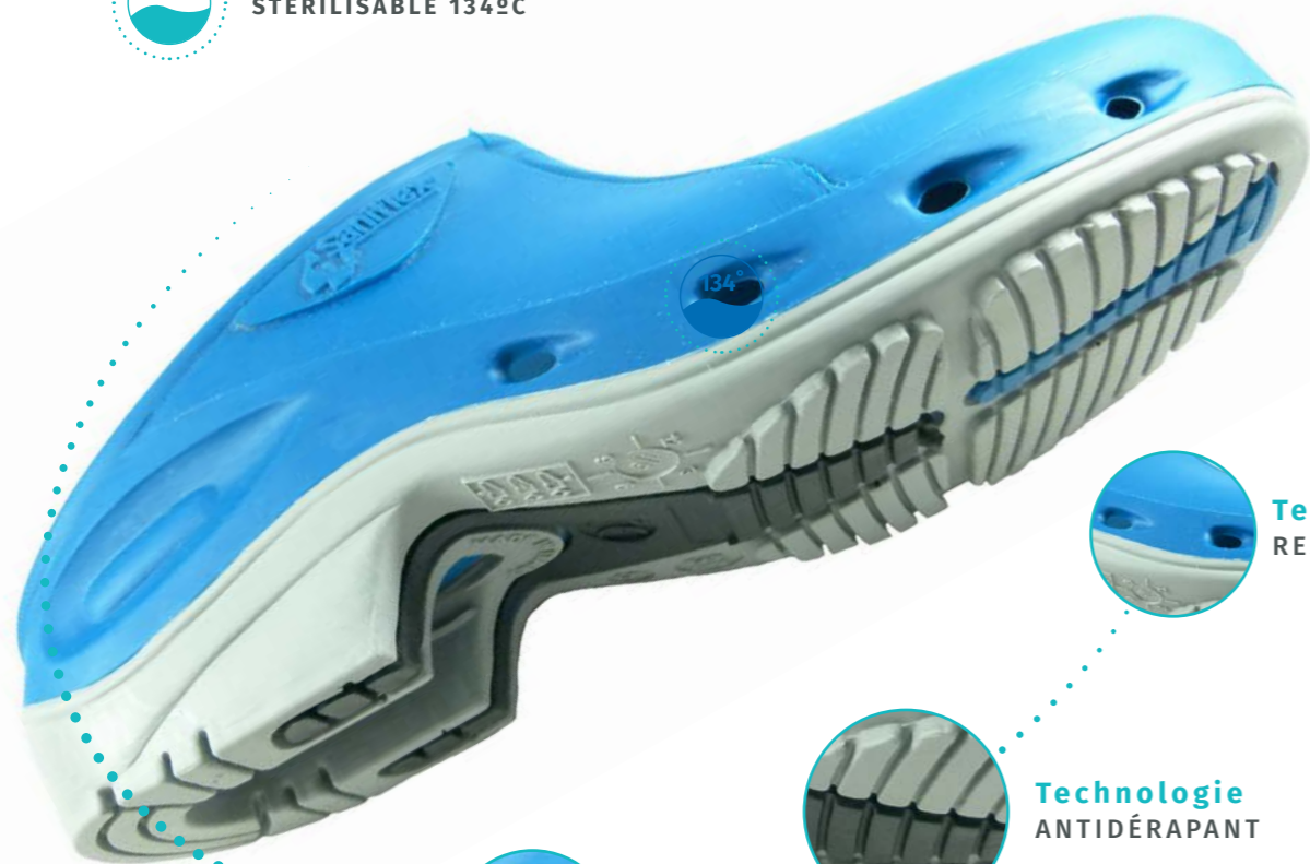
↓ SOCA TROKLÓ 141 35-45 | Bleu