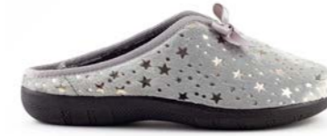
SIENA 35-41 | Gris