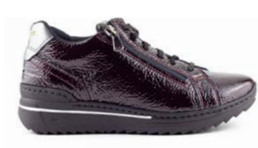
MULARI 35-41 | Bordeaux CHUT