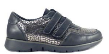
KUALA 35-41 | Noir CHUT