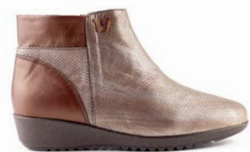
KIA 35-41 | Marron CHUT