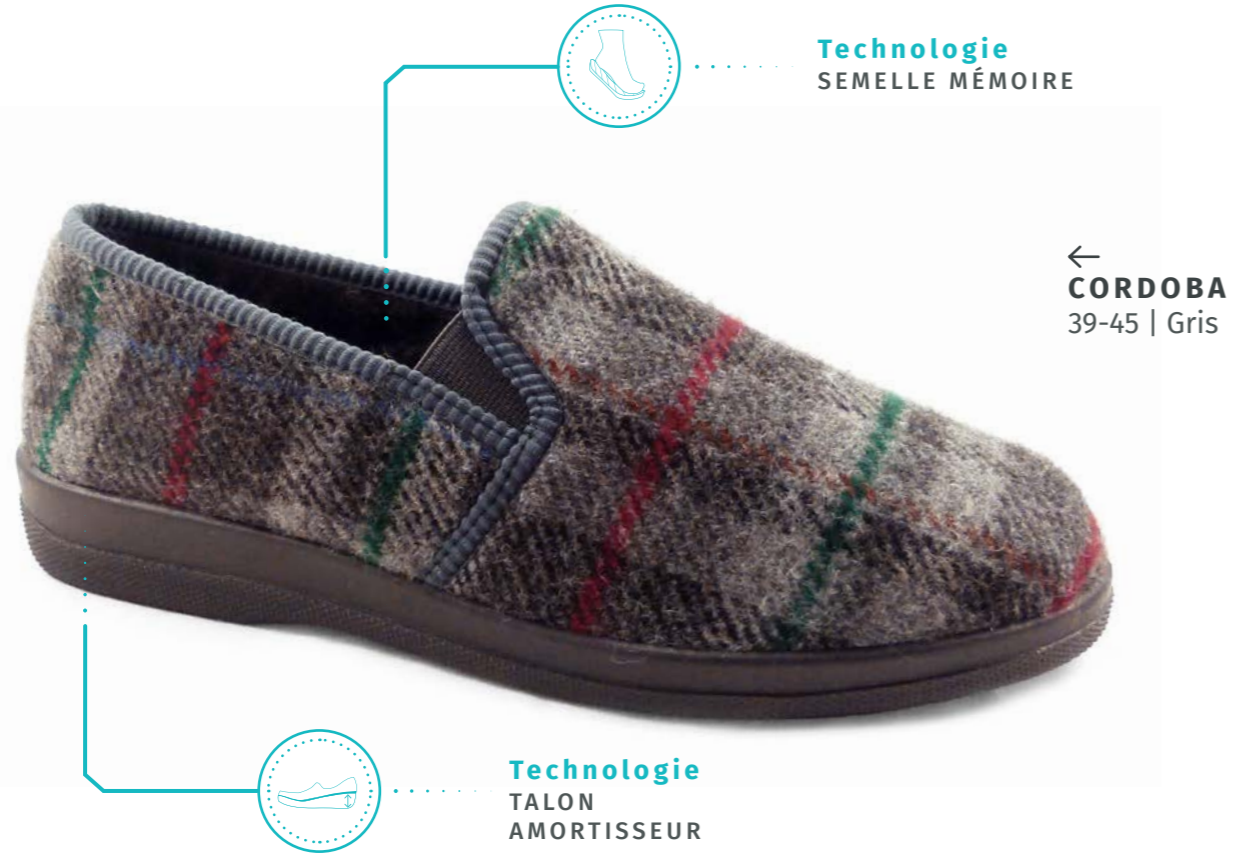
← CORDOBA 39-45 | Gris