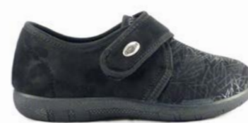
SURI 35-41 | Noir CHUT