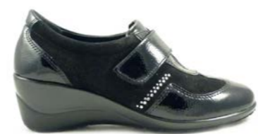
BETINA 35-41 | Noir CHUT