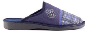
AGATA 39-45 | Bleu