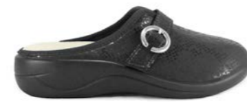
SALETE 35-41 | Noir