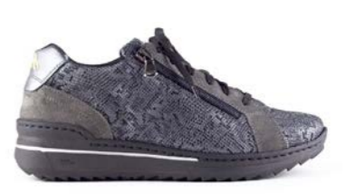
MULARI 35-41 | Gris CHUT