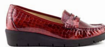
MACI 35-42 | Rouge CHUT