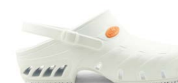
CLOG STUDIUM 35-45 | Blanc