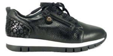
KALEO 35-41 | Noir CHUT