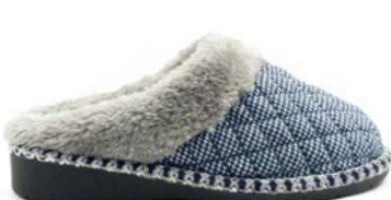
ASIA 35-41 | Bleu