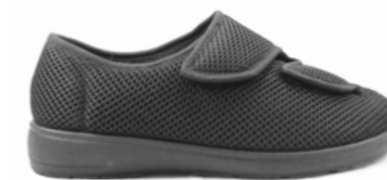
CRIS 35-42 | Noir CHUT