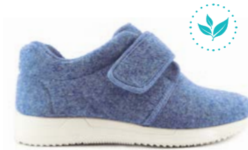
FLOYD 35-42 | Bleu CHUT