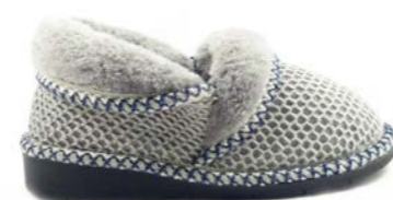
AMBER 35-41 | Gris CHUT