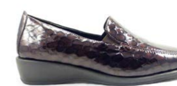
WINTER 35-41 | Marron CHUT