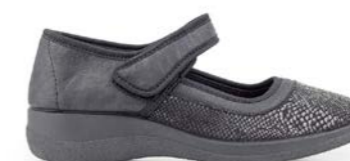
FLORI 35-42 | Noir CHUT