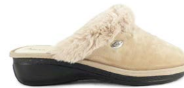
SERENA 35-41 | Beige