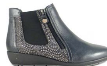
KENAI 35-41 | Noir CHUT