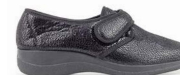
FOZ 35-42 | Noir CHUT