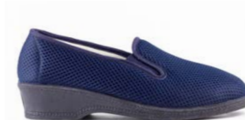
OLGA 35-41 | Bleu CHUT