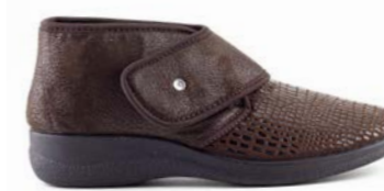
FERAN 35-42 | Marron CHUT