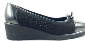
BESSIE 35-41 | Noir CHUT