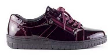
KANTIA 35-41 | Bordeaux CHUT