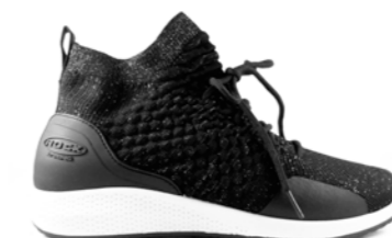
REINA 37-42 | Noir CHUT