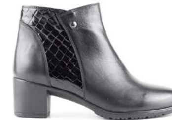
WIKI 35-41 | Noir