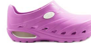
CLOG DINAMIC 35-45 | Rose