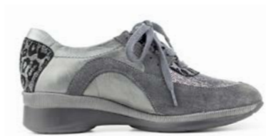
KIMMY 35-41 | Gris CHUT