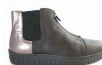
KOJI 35-41 | Marron CHUT