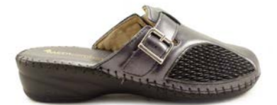
GROSSETO 35-41 | Noir