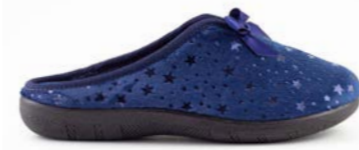
SIENA 35-41 | Bleu