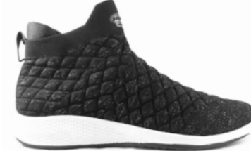
RUTH 37-42 | Noir CHUT