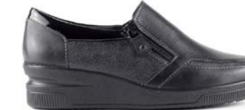
KLAME 35-41 | Noir, Bordeaux CHUT