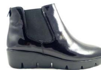
BAMBUI 35-41 | Noir CHUT