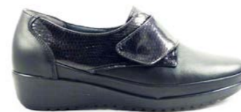
KEVIN 35-41 | Noir, Bleu CHUT