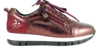
KALEO 35-41 | Bordeaux CHUT