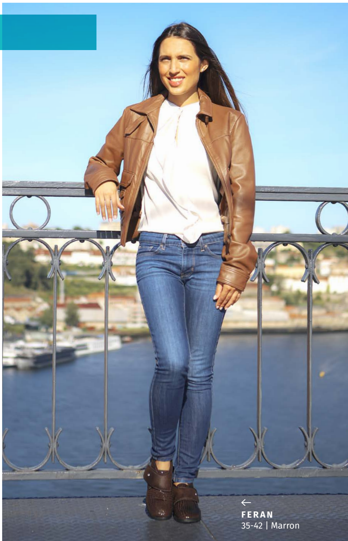
← FERAN 35-42 | Marron