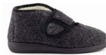
OLIVE 35-41 | Gris CHUT