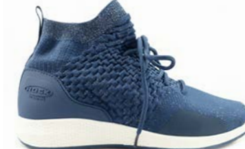
REINA 37-42 | Bleu CHUT