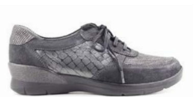
KALOKA 35-41 | Noir CHUT